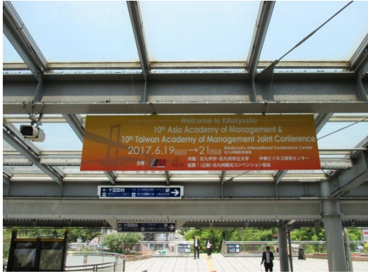
在小仓车站设置的大会招牌